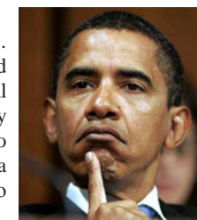
Barak Obama