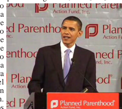
Barack Obama

Para obtener mayores informes al respecto de esta cuestión, acuda a la página web www.nrlc.org .