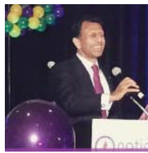
Gob. Bobby Jindal

Desde el inicio de la convención la noche del jueves, cuando se presentó el gobernador de Louisiana, señor Bobby Jindal, durante el “Festival en Celebración de la Vida,” los asistentes fueron brindados expresiones de convicciones pro vida por los candidatos pro vida para la presidencia.